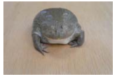
名称：マルメタピオカガエル

タランチュラの代名詞的な品種です。体長 8cm～20cm 程度。脚の間接部分が朱色の毛で覆われ、朱と黒のバンド模様をしています。普段は温厚な性格ですが、危険を感じると後脚で腹部をこすって毒毛を飛ばします。