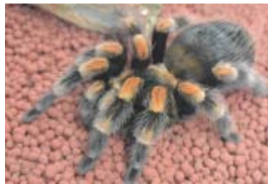
名称：メキシカンレッドニータランチュラ

クモとサソリとタガメを合体させた後に、踏み潰したような扁平で手足の長い節足動物です。体長 5mm～4cm 程度。世界 3 大奇蟲の一つとされ、日本には生息していません。